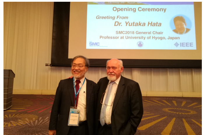
A megválasztott IEEE elnök és IEEE SMC elnök