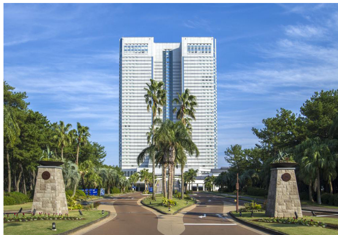
A konferencia helyszíne: Miyazaki Sheraton Grande Ocean Resort and Conference Centre